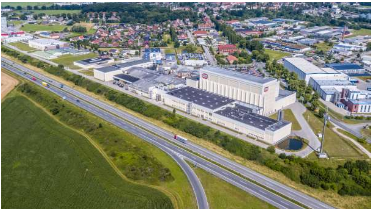
2017 - Luftaufnahme – Das Werk