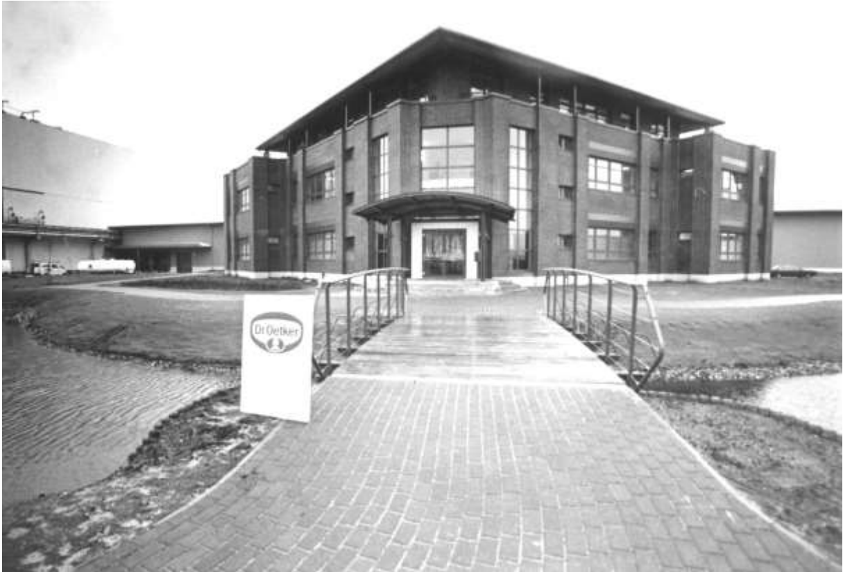
1993 – Eingang zum Verwaltungsgebäude