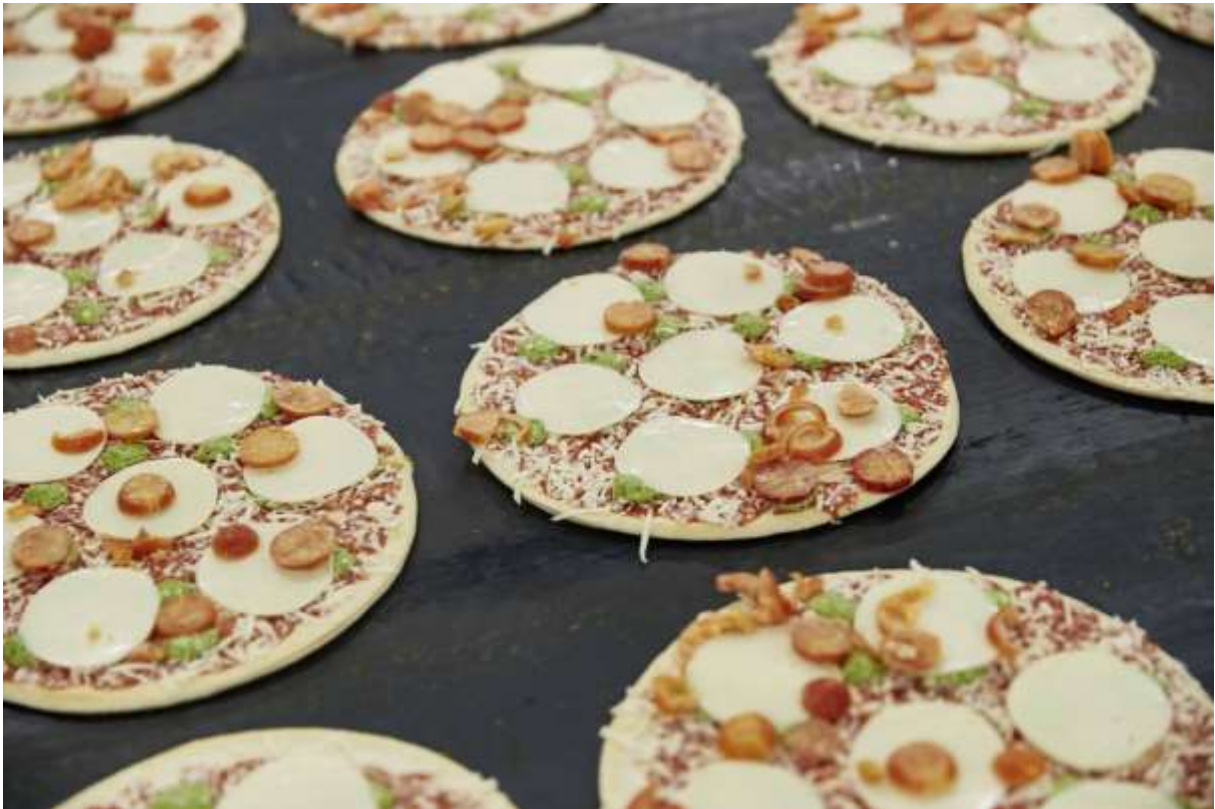
2016 - Pizza Ristorante Mozzarella wird in Wittenburg hergestellt