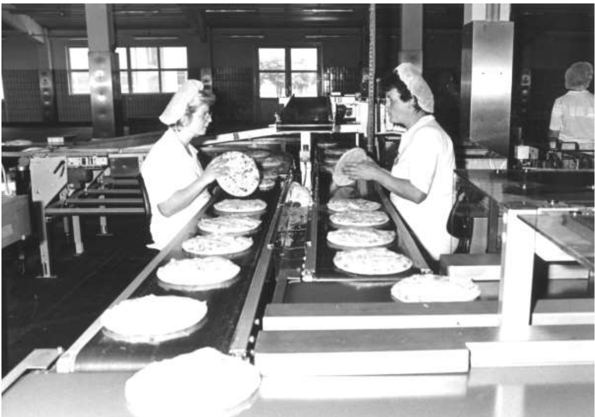
1993 – Produktionsmitarbeiterinnen Dr. Oetker Werk Wittenburg