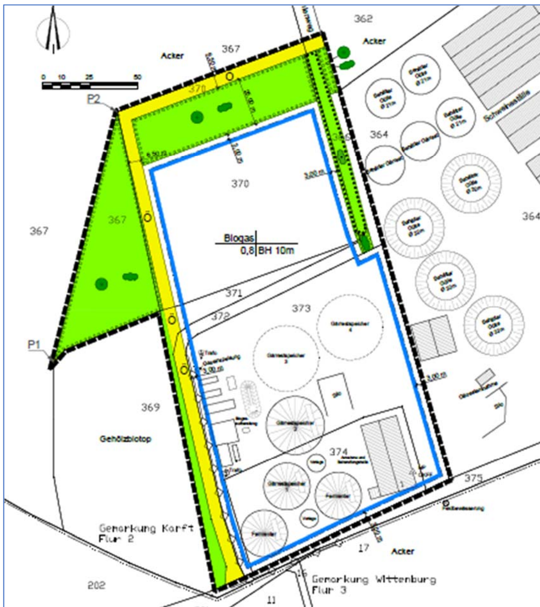
Abbildung 1: Lageplan der Biogasanlage

Nachfolgend angefügt ist der B-Plan des aktuellen Bauleitverfahrens, sowie nachfolgend das Luftbild mit den genannten Bestandteilen und den benachbarten Schutzobjekten.